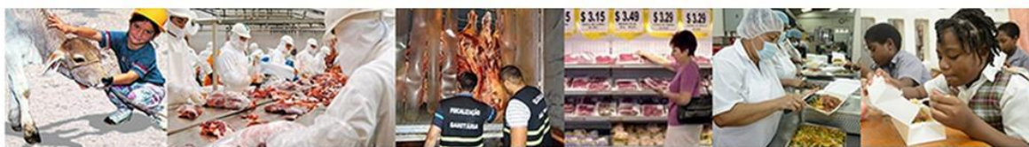
PANAFTOSA-OPS/OMS | Centro Panamericano de Fiebre Aftosa - Salud Pública Veterinaria