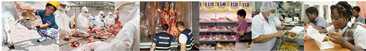
PANAFTOSA-OPS/OMS | Centro Panamericano de Fiebre Aftosa - Salud Pública Veterinaria